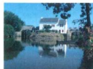
Maison de l'Éclusier ⑦