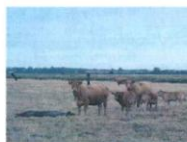
Croix de la Ganache ②