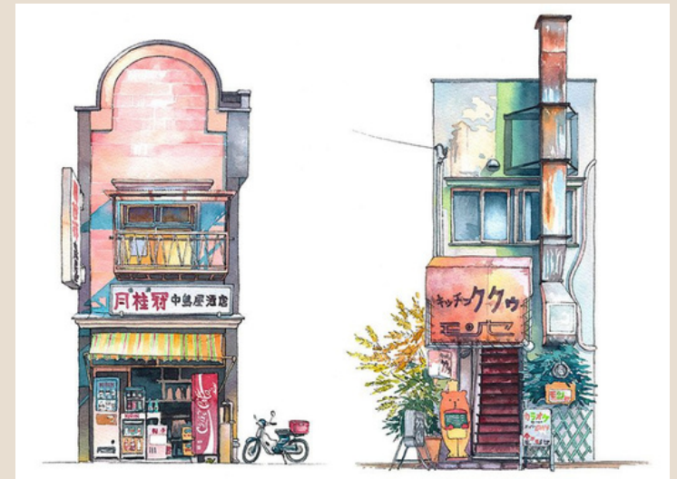
Les boutiques de Tokyo Mateusz Urbanowicz