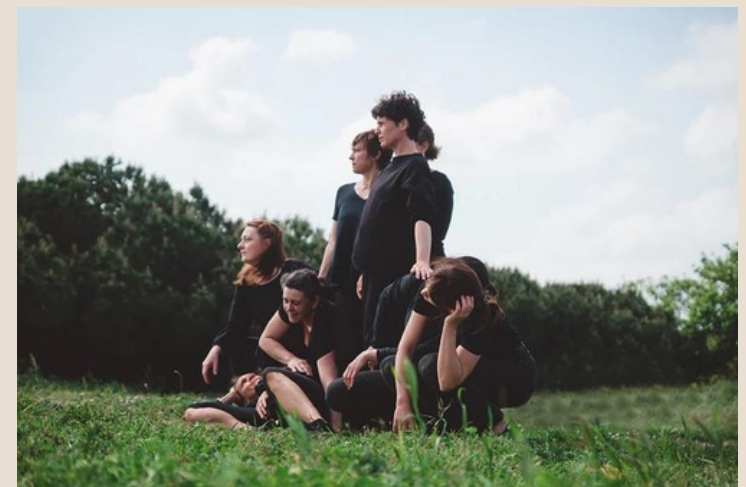
Cie La Petite pièce