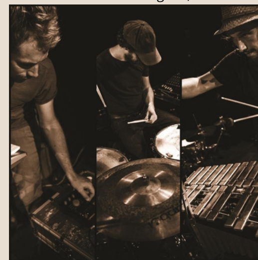
Bokk - Les rencontres musicales